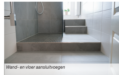
Wand- en vloer aansluitvoegen