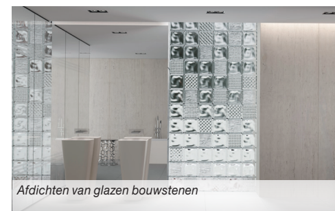
Afdichten van glazen bouwstenen