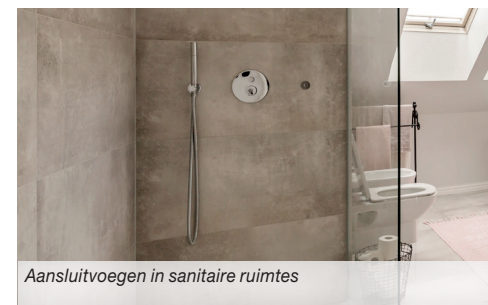
Aansluitvoegen in sanitaire ruimtes