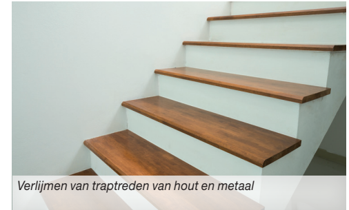
Verlijmen van traptreden van hout en metaal