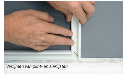
Verlijmen van plint- en sierlijsten