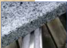
OTTOCOLL® M500 für elastische Klebungen unterschiedlichster Materialien im Außenbereich.