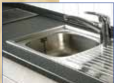
OTTOCOLL® M500 zum Kleben und Dichten von wasserbelasteten Fugen im Innenbereich.

OTTOCOLL® M500 verursacht keine Verfettung und ist somit für Marmor und Naturstein geeignet .