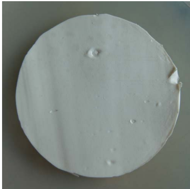
Foto 1: Novasil®M378, Farbe weiß nach einer Inkubationszeit von 28 Tagen ohne sichtbaren Pilzbewuchs