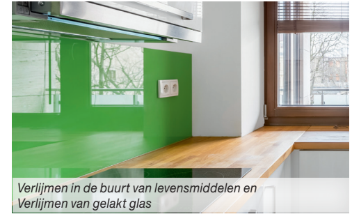
Verlijmen in de buurt van levensmiddelen en Verlijmen van gelakt glas