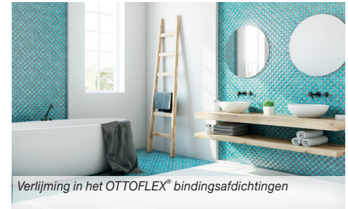
Verlijming in het OTTOFLEX® bindingsafdichtingen