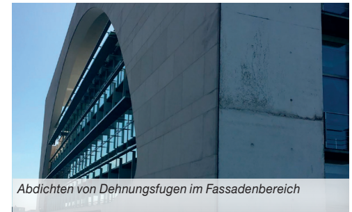
Abdichten von Dehnungsfugen im Fassadenbereich