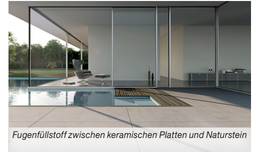
Fugenfüllstoff zwischen keramischen Platten und Naturstein