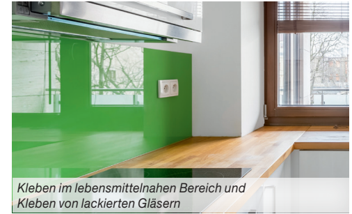
Kleben im lebensmittel-nahen Bereich und Kleben von lackierten Gläsern