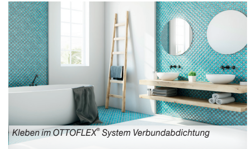
Kleben im OTTOFLEX® System Verbundabdichtung