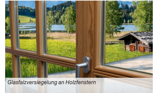
Glasfalzversiegelung an Holzfenstern