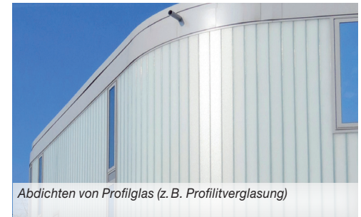
Abdichten von Profilglas (z. B. Profilitverglasung)