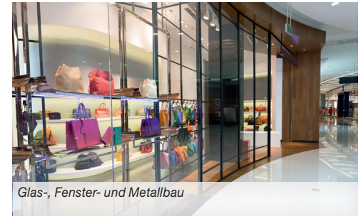
Glas-, Fenster- und Metallbau